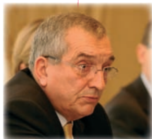
Jean-Jacques Hyest, Sénateur, Président de la commission des lois. Journée Prévention, septembre 2008.

La procédure d'alerte a été déclenchée dans plus de 3 000 cas.