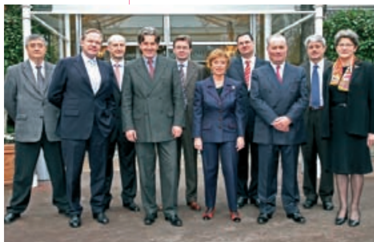
Les membres du Bureau élus le 1 er février 2007

La Compagnie Nationale des Commissaires aux Comptes est administrée par un Bureau et un Conseil National, des instances particulièrement actives et réactives ces deux dernières années. Souvent sollicités, les élus sont en effet mobilisés sur des sujets majeurs pour l'exercice et l'avenir de la profession.