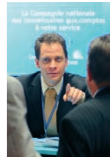
Présence de la CNCC aux différentes manifestations professionnelles.