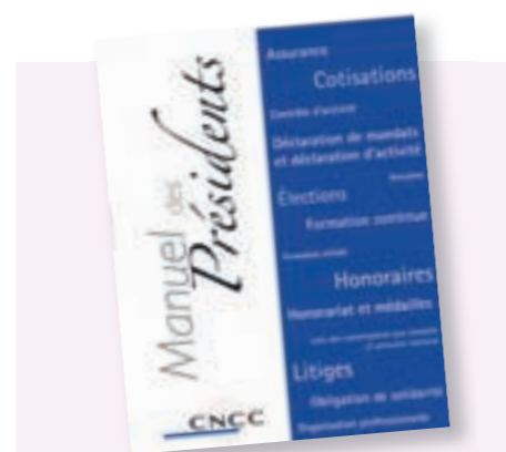
Le Manuel des Présidents Véritable boîte à outils, il est un memento à la disposition des 33 présidents.

Outre la fonction d'accompagnement, les Compagnies Régionales assurent la représentation de la profession auprès des instances juridiques, économiques, politiques et universitaires locales. Depuis de longues années, les auditeurs légaux entretiennent des rapports de haut niveau d'excellence avec les organes de justice, sous forme de rendez-vous réguliers ou même de formations adaptés aux magistrats. Ils veulent